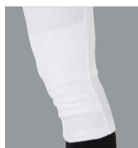
ひざ2重 (APP7S01/APP7S02 のみ対応)