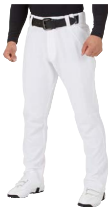
ホワイト ストレートロング APP7S03 (マーク有、ひざ加工なし)