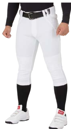
ホワイト ショートフィット APP7S01 (マーク有、ひざ2重加工)

投、捕、打、走 野球の基本姿勢から最大のパフォーマンスを発揮させる為、より身体にフィットさせる立体的なエルゴカットを採用。 また、人体工学の視点からポケットもより使いやすい角度に変更しています。 膝は生地2重加工 (APP7S03、APP7S01-NN、APP7S02-NNは除く)。 抜群のストレッチ性、履き心地、洗濯の汚れ落ちやすさは継続です。