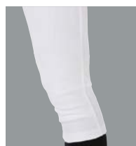
ひざ加工なし (APP7S03/ APP7S01-NN/ APP7S02-NN)