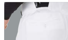
マーク無し (APP7S01-NN/ APP7S02-NN)