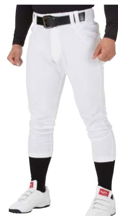
ホワイト レギュラー APP7S02-NN (マーク無し、ひざ加工なし)